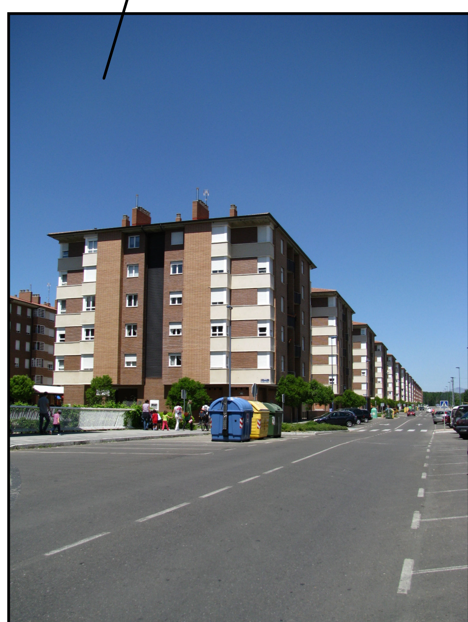
C/ Cronista Luis Pastrana