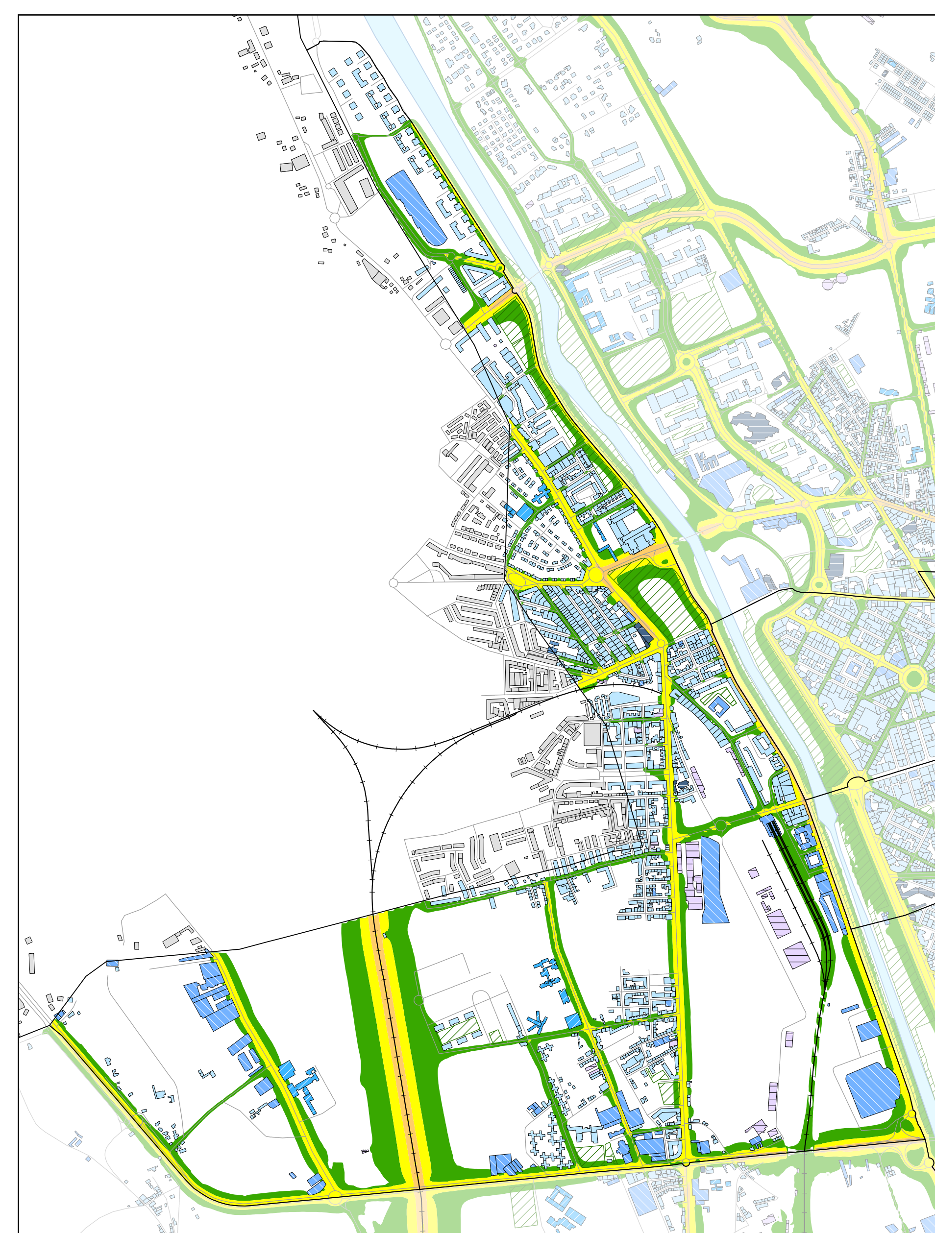
Mapa de niveles sonoros Ln - ruido total. Escala 1:12.000