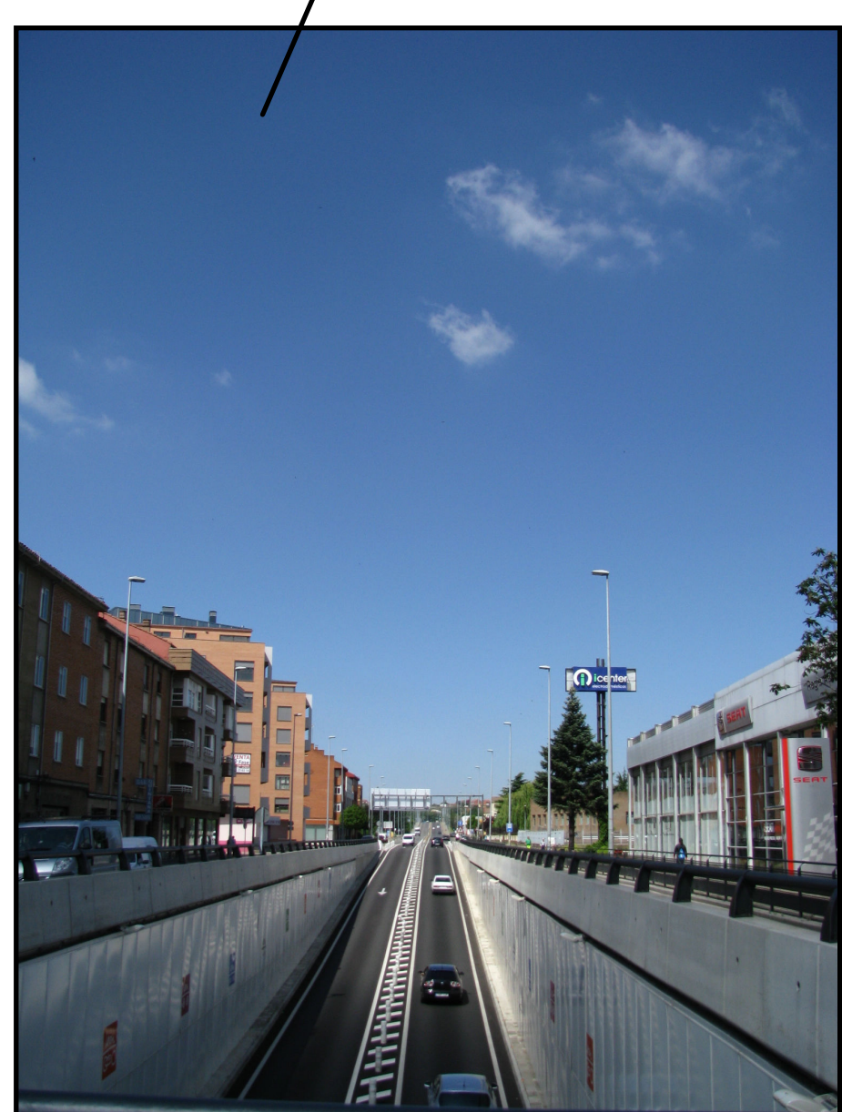
Cruce de Michaisa