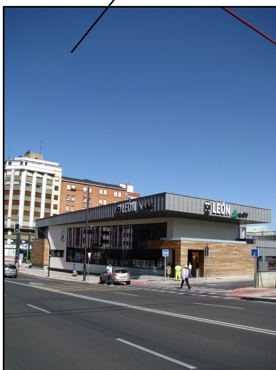
Estación de tren de León