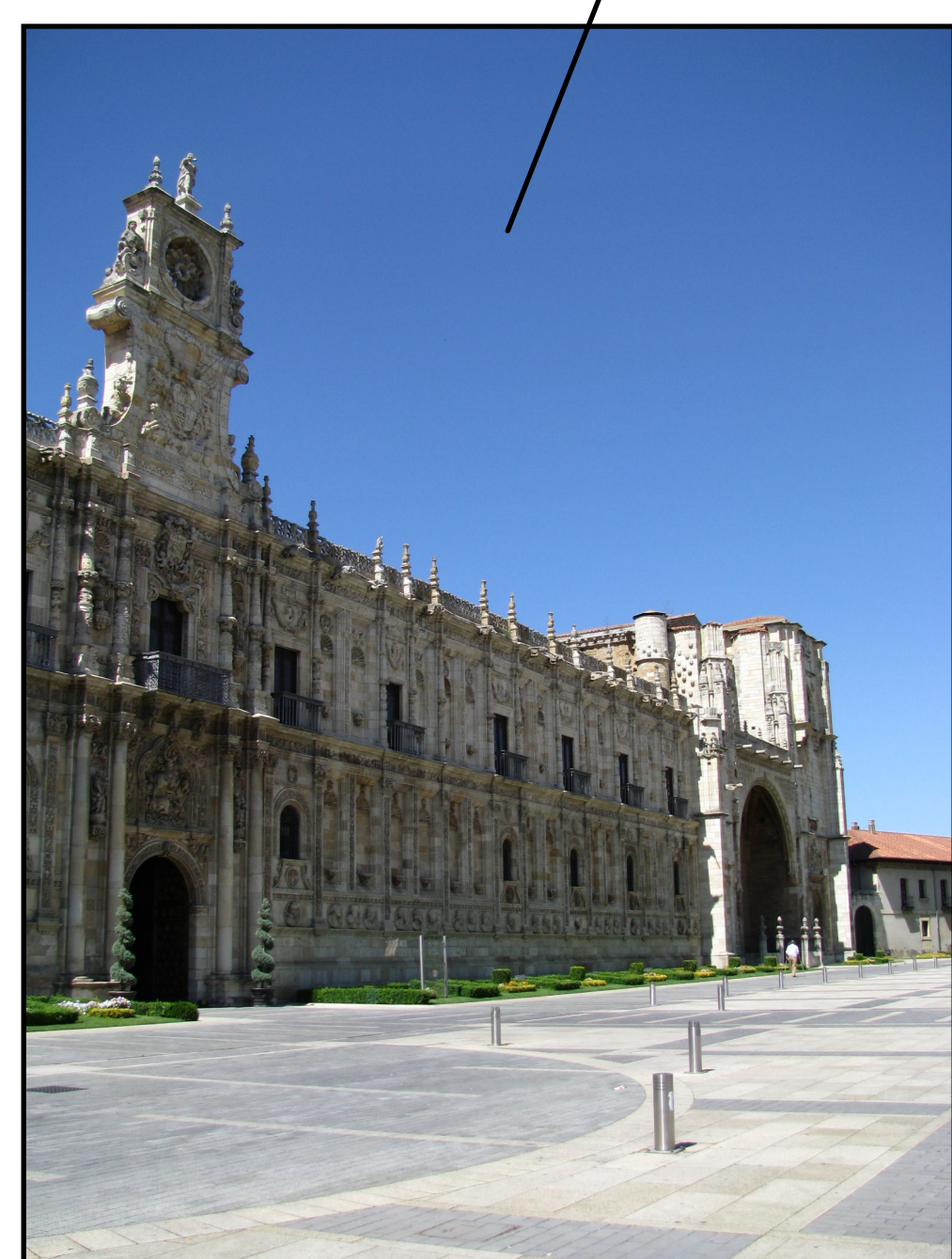
Hostal de San Marcos