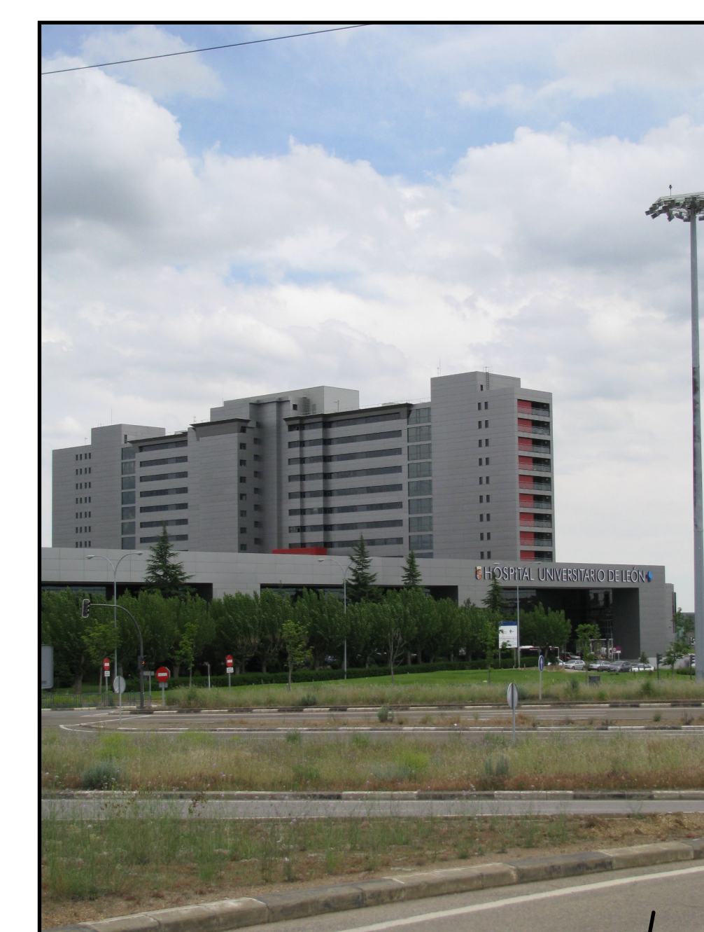
Hospital Universitario de León