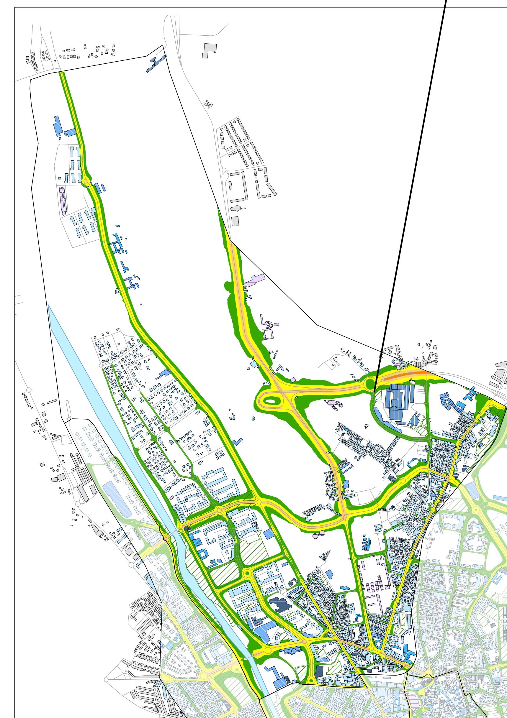
Mapa de niveles sonoros Ln - ruido total. Escala 1:15.000