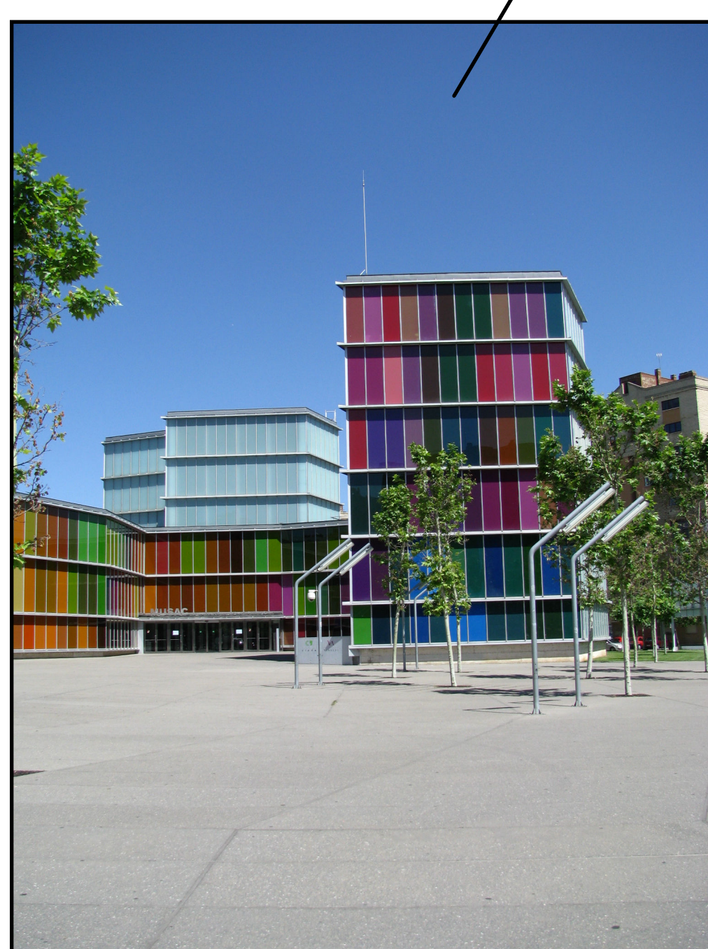
Museo de Arte Contemporáneo de Castilla y León - MUSAC